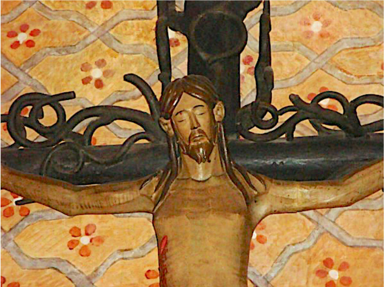
Abbaye Saint-Pierre de Moissac (1130-1140)