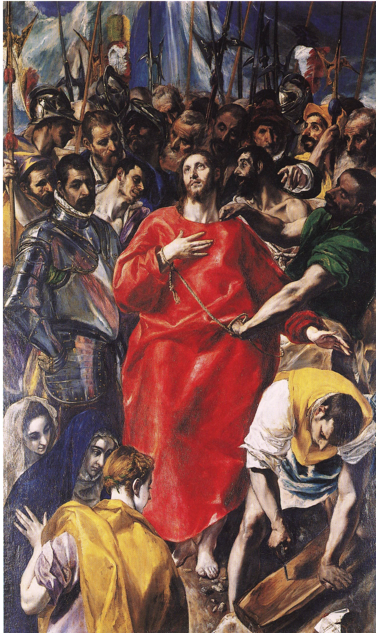
Le Dépouillement du Christ - Le Greco (1577-1579)