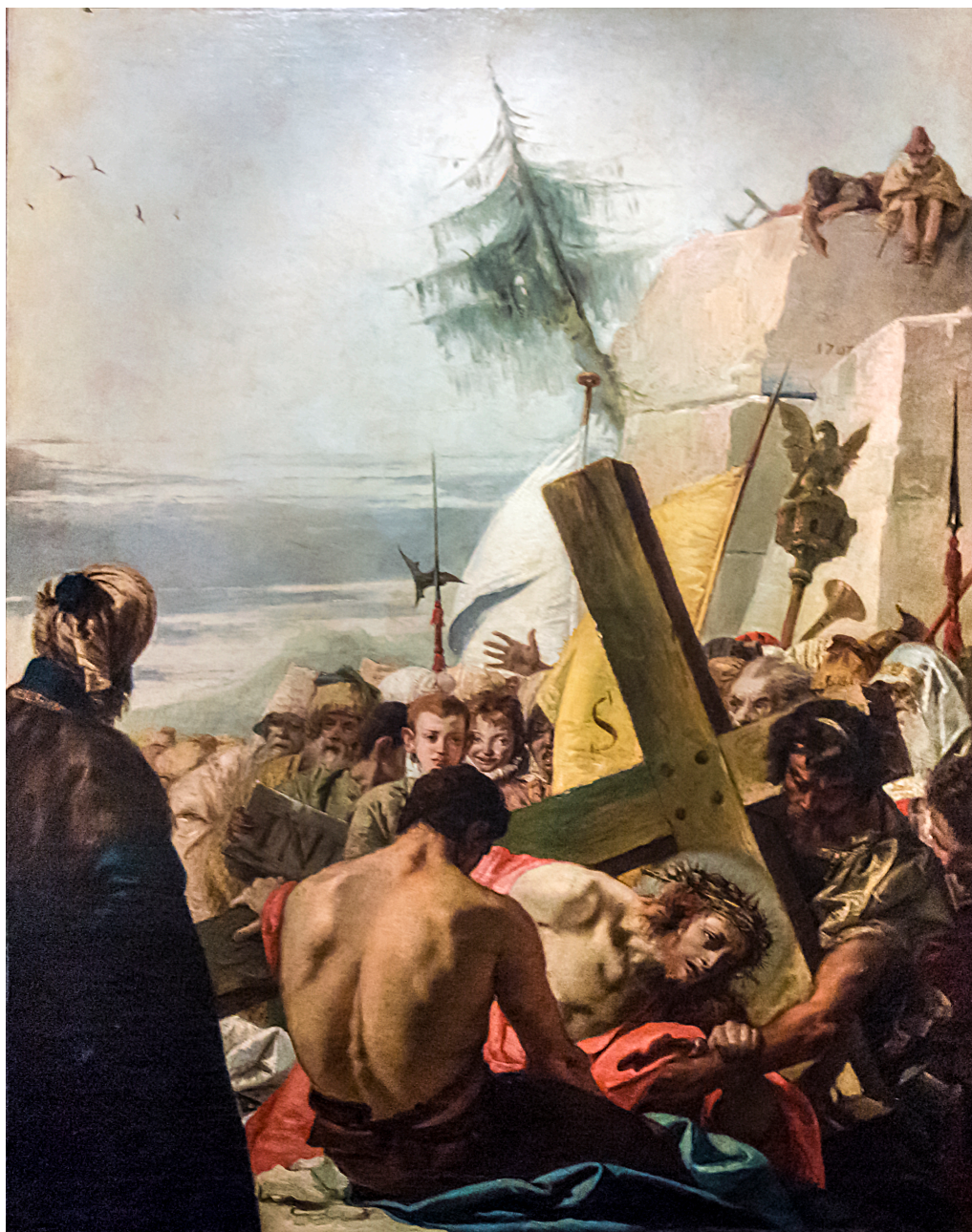
Giandomenico Tiepolo - Via Crucis IX (1745-1749) - Église Saint-Paul (Venise)