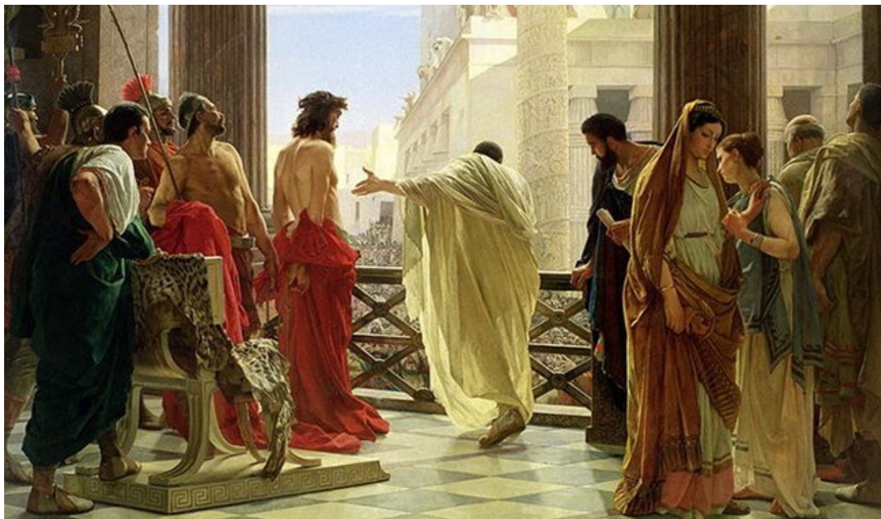
Ecce Homo, par Antonio Ciseri, 1862, Palais Pitti, Galleria d'Arte Moderna, Florence