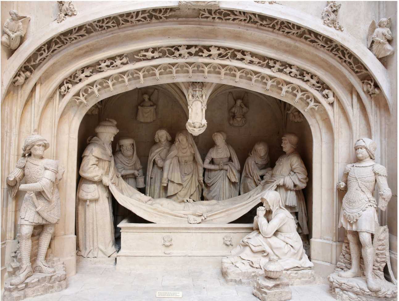
Eglise-abbatiale de Solesmes (Sarthe), 1496