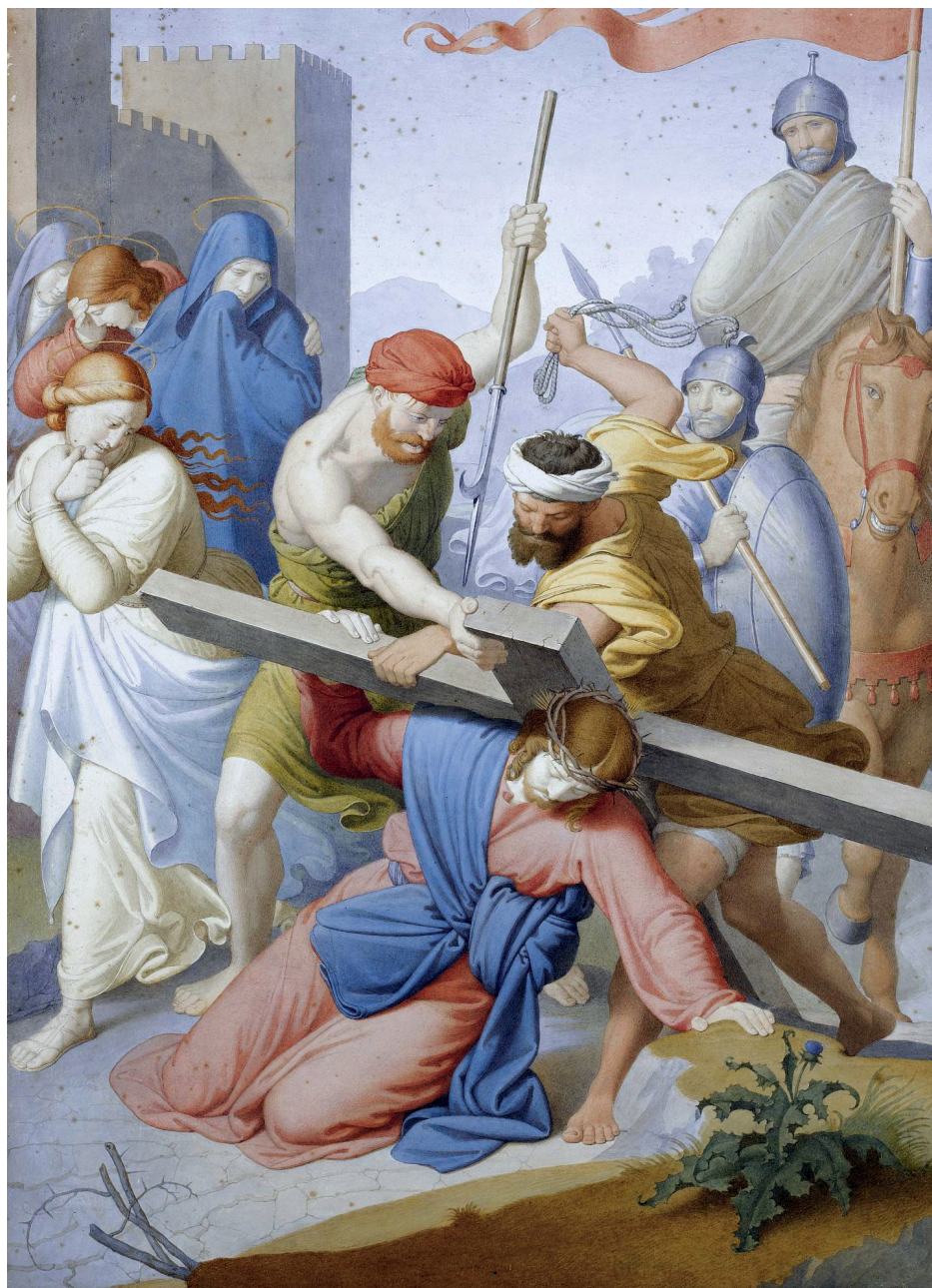
Johann Friedrich Overbeck (1789-1869) - Via Crucis