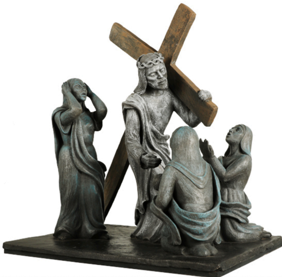
Liliane Caumont - Cathédrale de Metz - Grès patiné