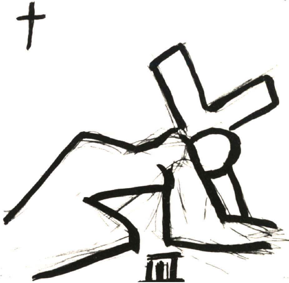
Henri Matisse - Étude pour la Chapelle du Rosaire, Saint-Paul-de-Vence