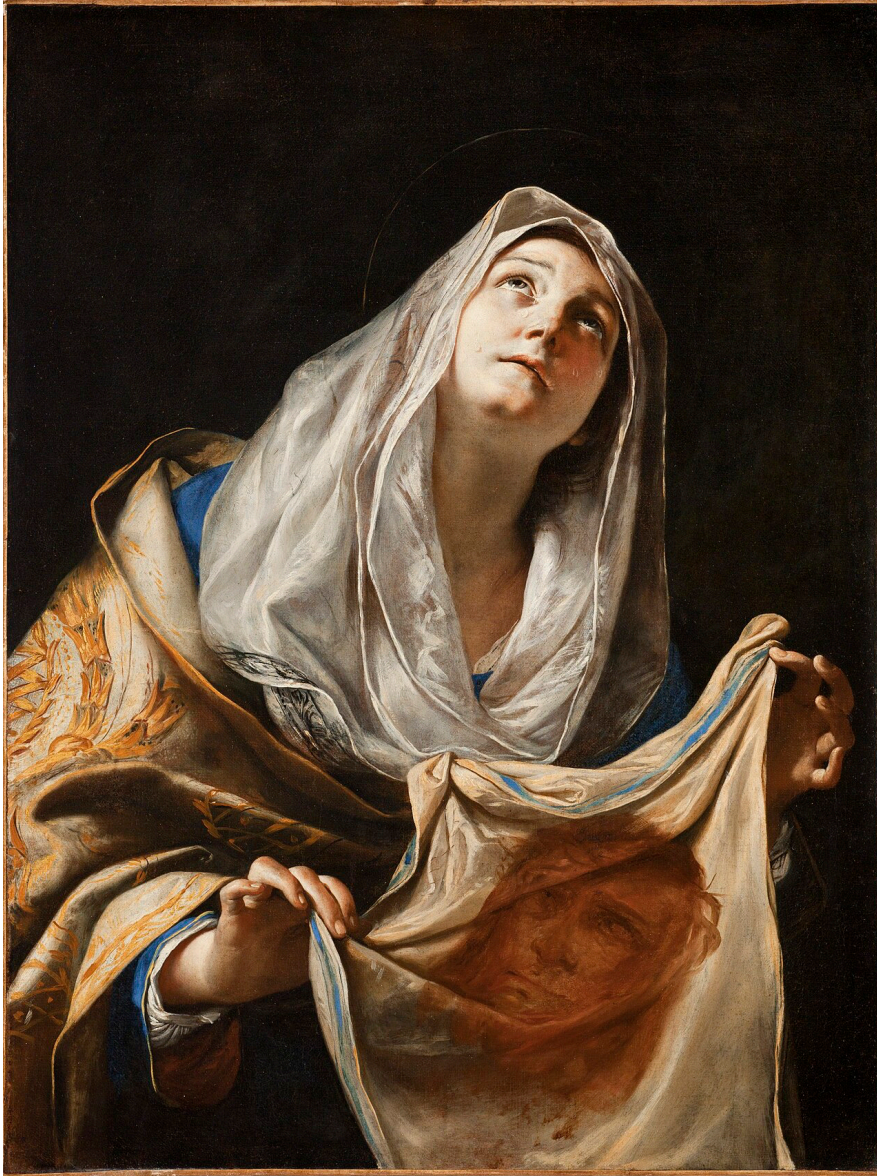
Mattia Preti - Sainte Véronique au voile (vers 1655-1660), musée d'Art du comté de Los Angeles