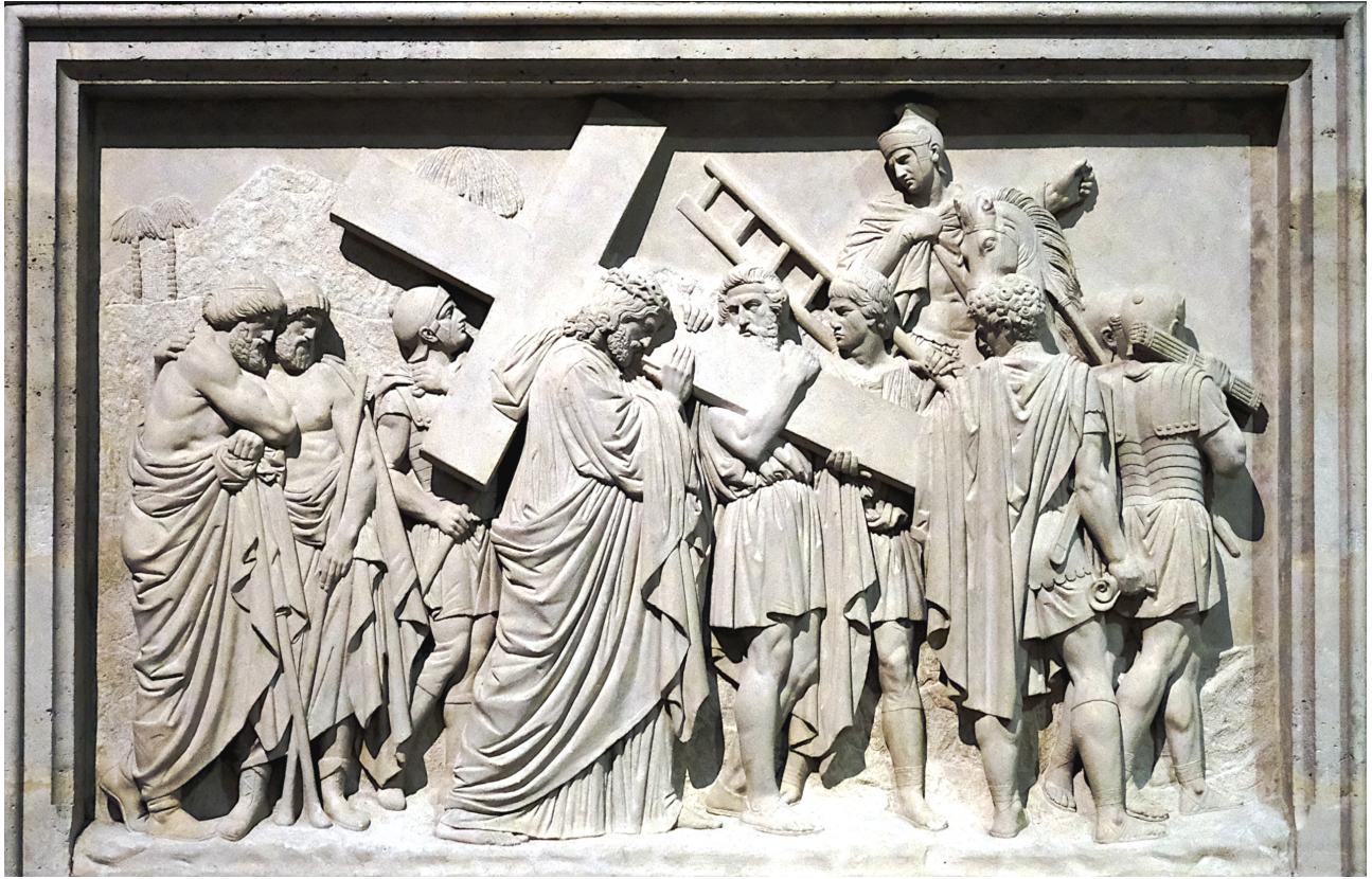
Basilique Sainte-Clotilde de Paris